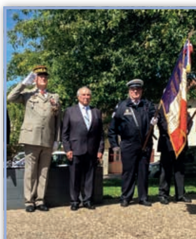
FNCA section locale