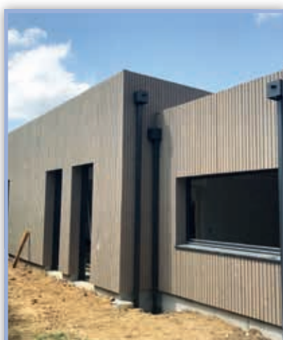
Agrandissement de l'école